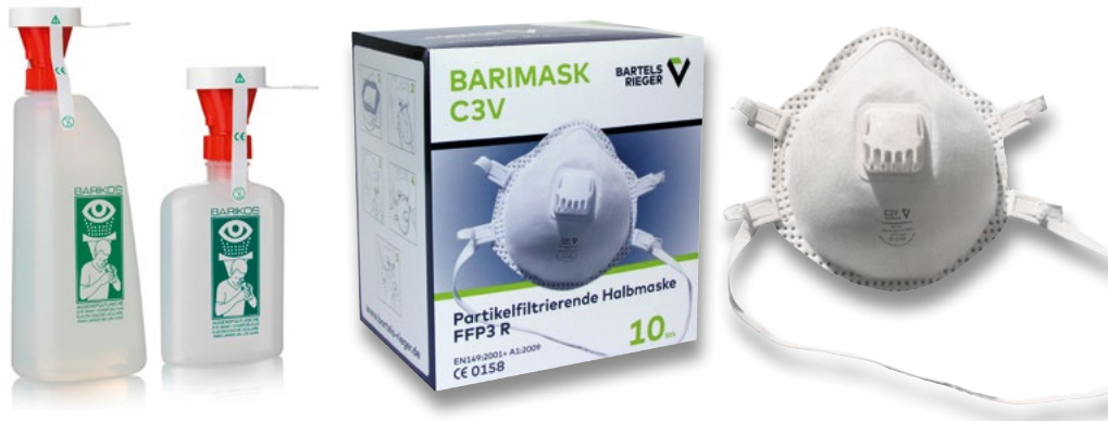
Augenspülflaschen und FFP-Masken von BartelsRieger

Die BartelsRieger Atemschutztechnik GmbH ist ein neuer Lieferantenpartner der NORDWEST Handel AG. Das Unternehmen gehört zu den führenden Anbietern des industriellen Atemschutzes und ist auf die Entwicklung von Sonderlösungen für die mobile Atemluftversorgung spezialisiert. Das Sortiment von BartelsRieger erstreckt sich dabei über sämtliche Segmente des filternden und isolierenden Atemschutzes. Hochwertige FFP-Masken, Atemschutzmasken, Schraub- und Steckfilter gehören ebenso zum Angebot wie verschiedene Druckluft-Schlauchgeräte. Das Angebot von BartelsRieger geht aber weit über Serienprodukte hinaus. Das Unternehmen ist als Spezialist für die Entwicklung von Sonderlösungen für die mobile Atemluftver-