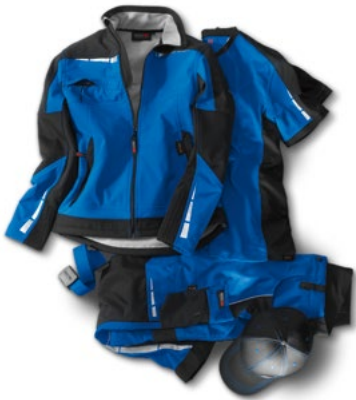
Die Premium-Linie ist in gelb, schwarz, königsblau, grün und grau erhältlich.