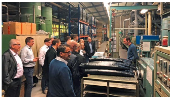
InTECH-Teilnehmer in der Fertigung der Fa. Parsch