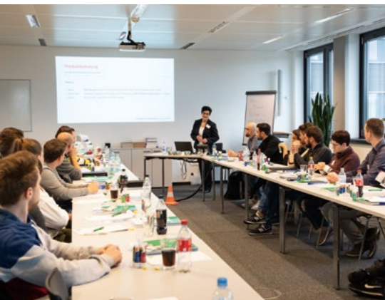
Teilnehmer der Produktschulung Arbeitsschutz in Dortmund