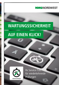
Zur Vorbereitung auf den Workshop: Das Elsinghorst- und das NORDWEST-Team Fachhandelspartner-Flyer

Unternehmen sind in der Pflicht, wartungsrelevante Produkte regelmäßig prüfen zu lassen. Zum Schutz, zur vorbeugenden Instandhaltung und zur Vermeidung von kostenintensiven Ausfallzeiten müssen Prüftermine detailliert geplant und zusammengefasst werden. Der NORDWEST InTECH-Partner Elsinghorst stellte seinen Endkunden sein neues Service-Tool www.meine-wartung.de zur Dokumentation von Prüf- und Wartungsfristen vor. In einer zentralen Veranstaltung am Standort Bocholt schulte das NORDWEST-Team gemeinsam mit den Elsinghorst-Verantwortlichen durch das System. Im Anschluss führte das Elsinghorst-Team die Instandhalter durch das Unternehmen. Detaillierte Informationen für den Endkunden gibt die auf die NORDWEST-Fachhändler individuell zugeschnittene Broschüre „Wartungssicherheit auf einen Klick“. Bei Interesse wenden Sie sich an: Nik Schönhoff (n.schoenhoff@nordwest.com) oder telefonisch unter 0231/222-4111.