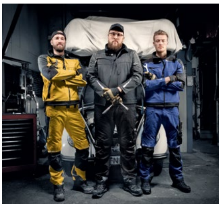
Dickies Pro setzt Maßstäbe in Ausstattung, Qualität und Optik.

Dickies Pro ist robuste und strapazierfähige Hightech-Workwear für Profis. Sie bietet körpernahe Schnitte, ergonomische Passform und außergewöhnlichen Komfort. Bundhosen, Softshell-Jacken, Shorts, Funktions-Shirts, Caps und Gürtel sind in fünf ausdrucksstarken Farben erhältlich.