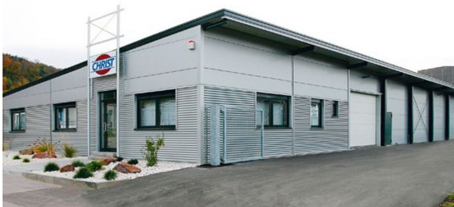
Firmengebäude Fa. Christ, St. Ingbert