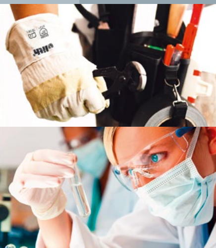
Verschiedene Einsatzgebiete der Marke „Ulith“

weise nicht nur der sich permanent erweiternden REACH-Kandidatenliste, sondern auch den neusten Gesetzesnovellierungen (z.B. EN 388: 2016) Rechnung.