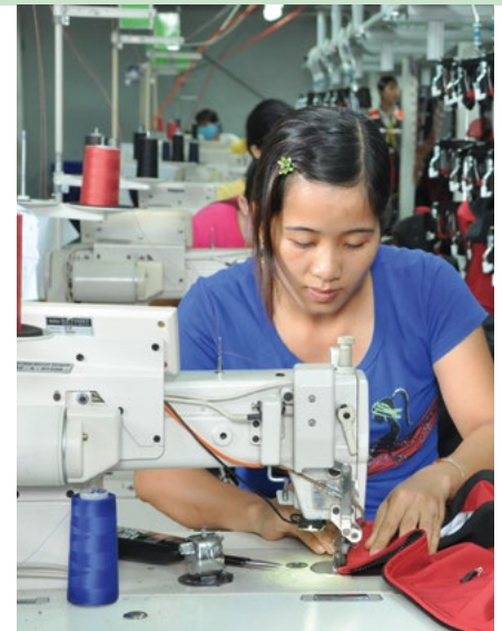
Produktion Fa. Mascot

Die SA8000-Zertifizierung garantiert, dass MASCOT keine Kinder- oder Zwangsarbeit einsetzt und allen Mitarbeitern angemessene Arbeitszeiten und Löhne bietet. Auch Standards bezüglich Gesundheitsschutz und Arbeitssicherheit sowie ein effektives Management-