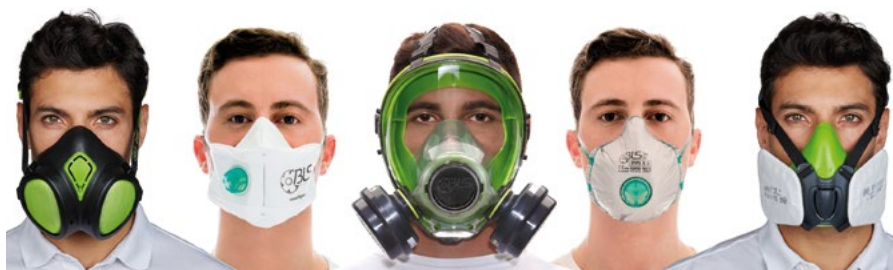
Auszug Produktsortiment Fa. BLS