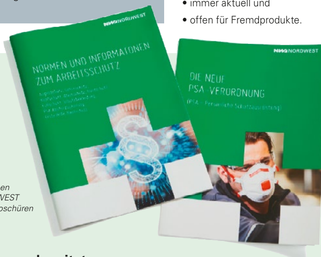
Die neuen NORDWEST PSA-Broschüren

Procter-&-Gamble Straße 26 D-53881 Euskirchen Tel. +49 2251 77617-0 info@pgp-hautschutz.de www.pgp-hautschutz.de