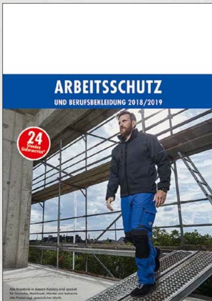
Der neue Arbeitsschutz-Katalog 2018/2019.

Um den Marktansprüchen gerecht zu werden, wurde die neue Katalogausgabe im Inhalt und Layout überarbeitet und modifiziert. Auf über 482 Seiten sind über 5000 Artikel in acht Kapitel übersichtlich dargestellt.