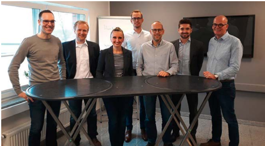
Mitarbeiter Hubert Graf GmbH und NORDWEST