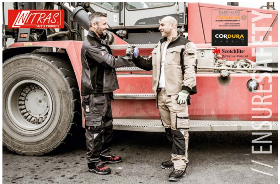
Arbeitsbekleidung MOTION TEX

Für gehobene Ansprüche ist die MOTION TEX PLUS-Serie die richtige Wahl. Stabile 280 g/m 2 Flächengewicht in Kombination mit weiteren