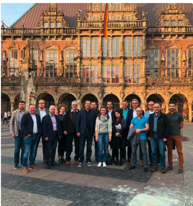
Teilnehmer der InTECH-Tagung in Bremen.

Pünktlich zum 60 jährigen Bestehen der Firma Benien folgten die InTECH Partner der Einladung des Händlerkollegen für die Frühjahrs-Tagung nach Bremen.