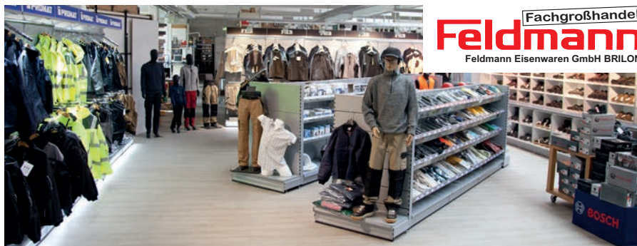
Shop-Präsentation - Arbeitsschutz Fa. Feldmann

Genfer Str. 8 D-60437 Frankfurt Tel. / Fax +49 69 950948-700 / -747 info@dengler-online.de www.dengler-online.de