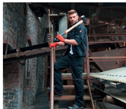
Bekleidungsreihe MOTION TEX LIGHT

Zudem ist MOTION TEX LIGHT Oeko-Tex 100 zertifiziert und garantiert somit umfas-