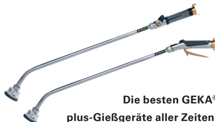
Die besten GEKA® plus-Gießgeräte aller Zeiten.

Wo es zudem auf Hygiene ankommt, ist der CS40 genau der Richtige. Konstruiert aus hochwertigem rostfreiem Chromstahl und für Trinkwasser geeignet, wird er den hohen Anforderungen an absolute Sauberkeit in Bereichen wie Großküchen, Schlachthöfen, Getränke- oder Lebensmittelindustrie oder Schwimmbädern perfekt gerecht.